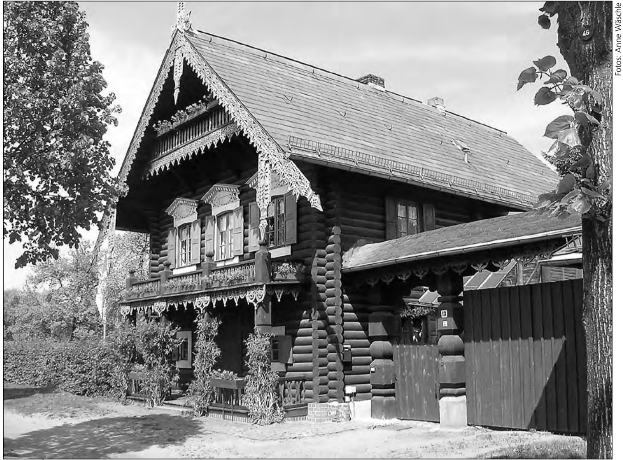
Auch wenn es ein bisschen wie im Schwarzwald aussieht, als Vorbild für die russische Kolonie diente das Dorf Glasowo bei St. Petersburg. Doch statt die Hütten mit Stroh zu decken, brachten die Militärhandwerker der preußischen Garderegimenter eine Holzverbreterung auf, die zum Ende des 19. Jahrhunderts gegen eine wetterfestere Schieferdeckung ausgetauscht wurde.