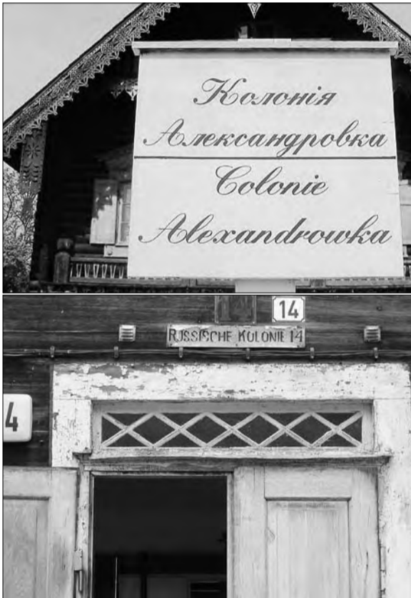
Am Eingang zur Kolonie verrät ein Schild auf Altrussisch und Deutsch, wo man sich befindet. Das königliche Teehaus mit der Nummer 14 könnte eine Restaurierung vertragen – die hat die Alexander-Newskij-Kirche schon hinter sich.